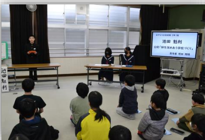
立会演説会の様子