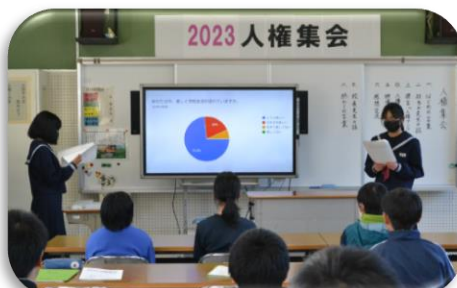
12/7 人権集会 中学生の発表 ～アンケート結果と今後の課題～